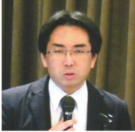
教授 / 博士 (工学)

ウィトルウィウス、ドイツ建築、森田慶一、増田友也、建築論、京都学派 戦後建築史、五十嵐直雄、公共建築、住まい、福井県