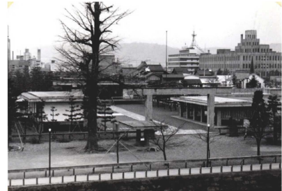
図3. 戦後福井の復興と五十嵐直雄の「福井神社」(1957)