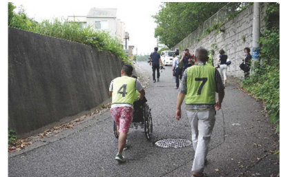
図4. 避難行動の実験, 要支援者避難の分析