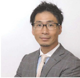
教授 / 博士 (工学)

防災減災対策、耐震性向上、防災教育、地域防災計画、医工連携、災害調査 被害分析、災害復興、要支援者避難、着るロボット