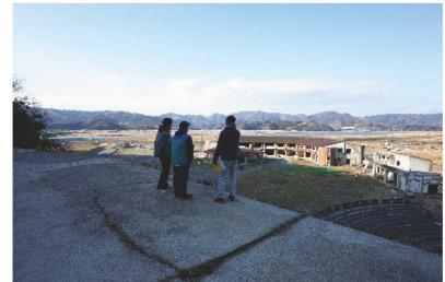
図1. 災害後の調査・復興に関する調査