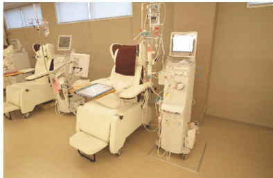
図2. 医工連携による災害対策・デザイン開発