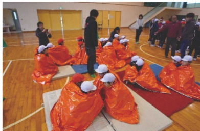
図3. 新しい防災教育に関する調査・研究